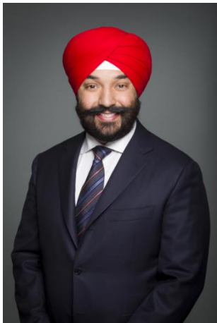
L'honorable Navdeep Bains Ministre de l'Innovation, des Sciences et du Développement économique

J'ai le plaisir de vous présenter le Plan ministériel de Statistique Canada pour 2017-2018.