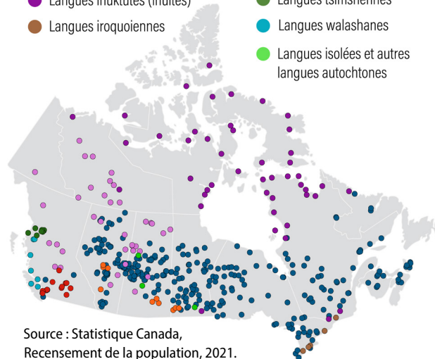
Source : Statistique Canada, Recensement de la population, 2021.

En 2021, une plus faible proportion d'adultes autochtones détenaient un titre d'études postsecondaires par rapport aux adultes non autochtones, en partie en raison d'obstacles comme l'éloignement géographique, surtout pour les Inuit.