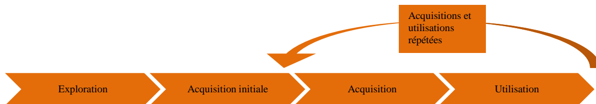
Figure 2-1 Modèle d'acquisition et d'utilisation des données administratives

Le processus d'acquisition et d'utilisation des données administratives se déroule en quatre phases débutant après la découverte du fichier, soit les phases « d'exploration », « d'acquisition initiale », « d'acquisition » et « d'utilisation ». À la phase d'exploration, l'acquéreur contacte le fournisseur du fichier. Il se familiarisera avec le contenu, les concepts, les caractéristiques et le contexte de création du fichier par le biais de communications avec le fournisseur, de consultations de la documentation et des métadonnées, mais sans nécessairement avoir accès au fichier. À défaut d'avoir été identifiées au préalable de façon précise, les utilisations devraient l'être au cours de cette phase, mais pourraient encore évoluer par la suite. L'information recueillie au cours de cette phase fait l'objet d'une évaluation qui permettra à l'acquéreur de juger la pertinence de poursuivre l'évaluation afin d'en arriver à une entente d'acquisition de données pour les utilisations visées.